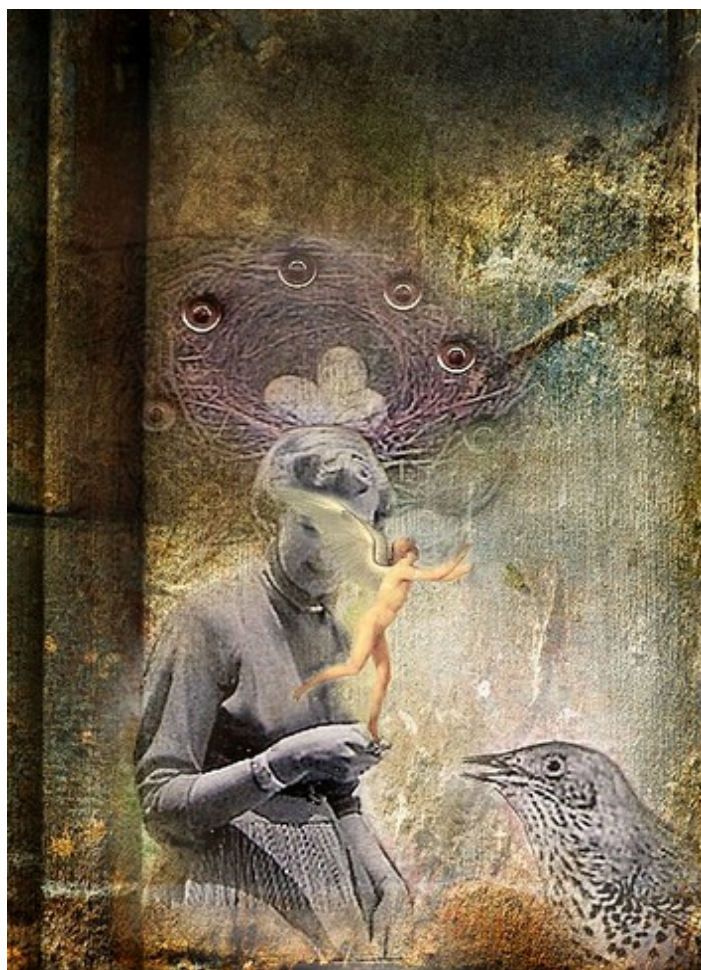
Art Cafe f/2 Exhibition with Artist Ulla Gmeiner "The art of poetic possibilities".

entdecke oft auf dem Schrottplatz oder Flohmarkt wunderbare Stücke, die ich in meine Skulpturen einarbeite, aber auch neue Möbel verändere ich so, dass sie nicht mehr wiederzuerkennen sind. Ein Beispiel ist der "Triumphbogen der Vergänglichkeit", bestehend aus vielen Ikea - Tischen, die mit Asche, Staub, Acrylfarbe und alten Buchausschnitten bearbeitet wurden.